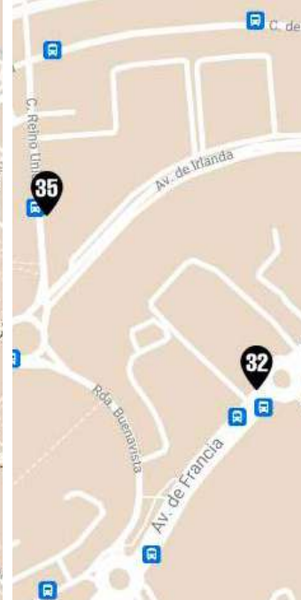
Q Buenavista y Avda. Europa.