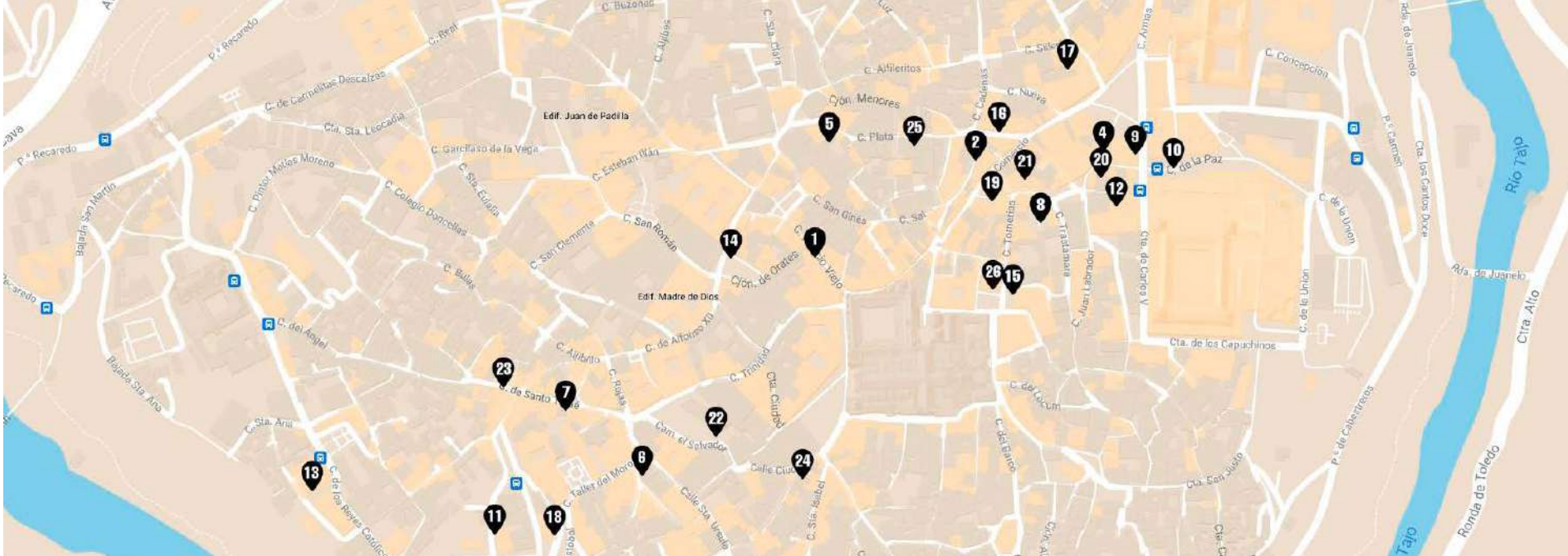
Q Casco Histórico